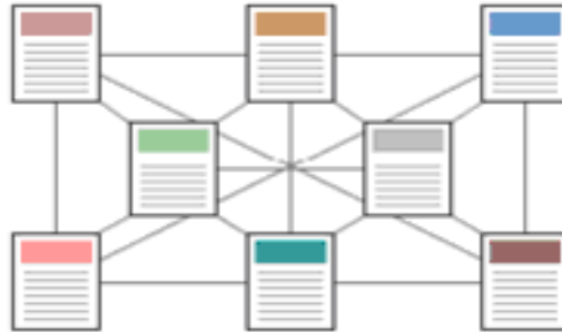
Şekil 5 Ağ Yapısı

Bu yapı getirdiği erişim kolaylığının yanında, karmaşıklığı artırmakta ve bakımı zorlaştırmaktadır.