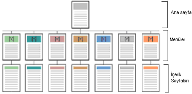
Şekil 6 Hiyerarşik Yapı

Aşağıdaki grafik bu dört tip yapılandırmanın çeşitli kriterler açısından karşılaştırmasını yapmaktadır. Grafikte yatay eksenle ilerledikçe anlaşılma zorluğu artmakta buna karşın esneklik kazanılmaktadır. Dikey eksenle ilerlemek ise karmaşıklığı artırmakta, kullanıcı bilgi düzeyinin artmasını gerektirmektedir.