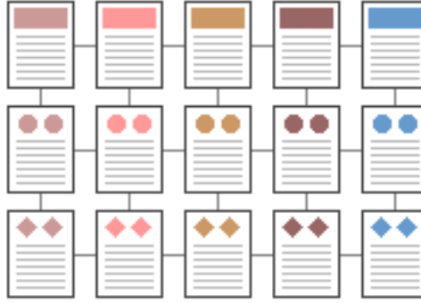
Şekil 4 Izgara Yapısı

Kullanılan bilgi organizasyonu türlerinden biri de Izgara Yapısı'dır. Bu yapıda dokümanlar arası bağlantılar bir ızgara yapısı şeklinde kurulur. Bağlantılar Bilgi Dizisi'nde olduğu gibi tek boyutlu olmayıp, her doküman tüm komşularına bağlantı içerir. Bu tür bir yapının kurulması, bazı kullanıcılar için anlama ve kullanma zorluğu yaratabilir.