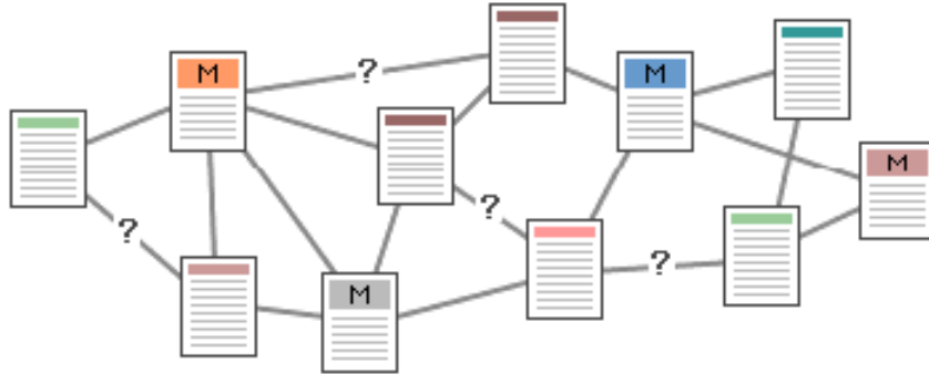
Şekil 2 Karmaşık yapı

Şekil 2 'de ise asla kurulmaması gereken bir bilgi organizasyonu gösterilmektedir. Bu örnekte, mantıksal bölümlenme yapılmamış, bağlantılar gelişigüzel verilmiştir. Sağlıklı dolaşım imkanı yoktur.