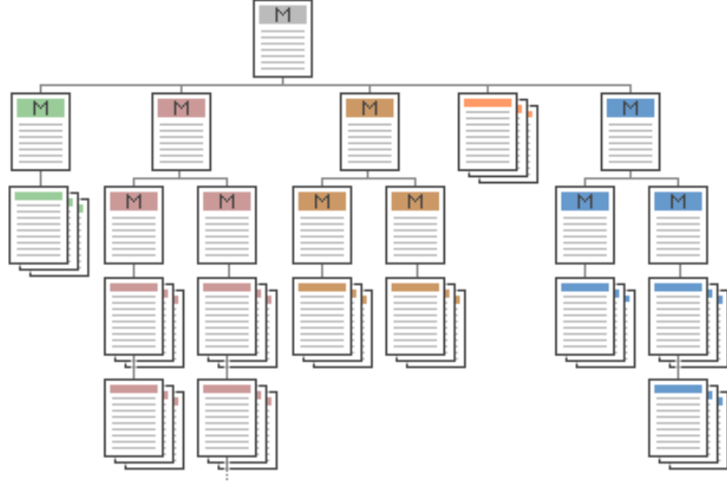
Şekil 10 Dengeli Menü Yapısı

Kamu kurumları internet sitelerinde site içi dolaşım sistemlerinin dengeli yapıda olmasına gayret gösterilmelidir. Kamu internet sitelerinde yer alan tüm sayfalar en az bir başka sayfaya bağlantı içermelidir. Her sayfa hiyerarşik yapıda bir üstünde olan sayfaya ya da ana sayfaya bağlanabilmelidir. Başka hiçbir sayfaya bağlantı içermeyen sayfalar “Çıkmaz Sokak” (Dead-End) olarak adlandırılır ve kullanıcı bu sayfalardan ancak tarayıcının sağladığı geri dönüş imkanıyla ayrılabilir. Kamu internet siteleri Çıkmaz Sokak içermemelidir.