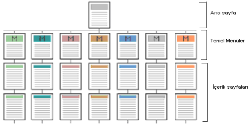
Şekil 1 Bilgi Yapılandırması

Site içinde sunulan bilgiler mantıksal anlamda tutarlı olacak şekilde organize edilmeli ve önem düzeyi de dikkate alınarak yapılandırılmalıdır. Şekil 1 'de örnek bir bilgi yapılandırılması verilmiştir. Bu yapı düzenli olup, her dokümanın kolay bulunabilmesini ve kolay geri dönüş imkanı sağlamaktadır.